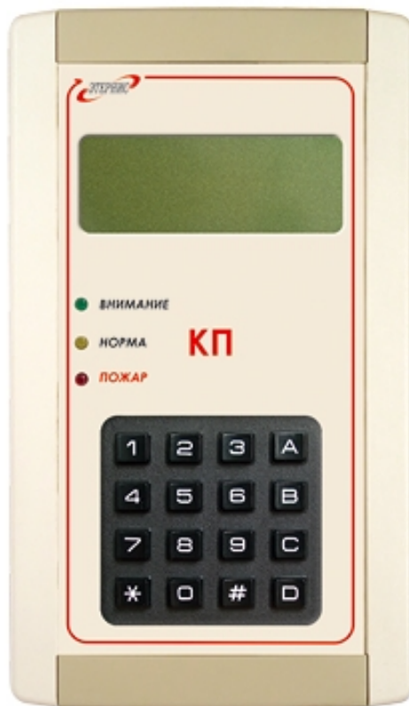
Рис. 1 – Внешний вид «КП»